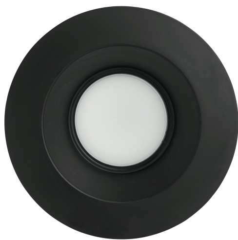
8-inch Trim - Round, Black Smooth (99546)