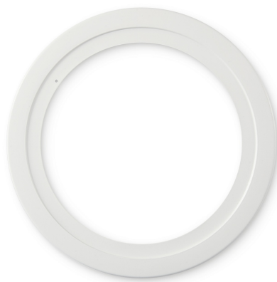
8" Goof Ring (70459)