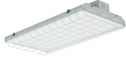
Wire Guard (99946)