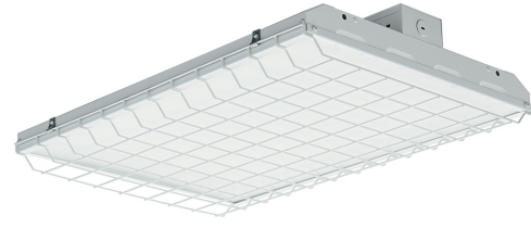
Wire Guard (99947)