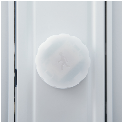
Highbay Sensor (70681)